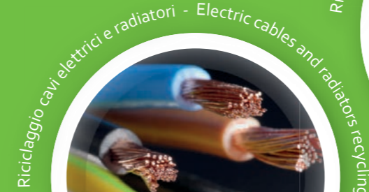
Riciclaggio cavi elettrici e radiatori - Electric cables and radiators recycling

Die neue Serie von Vorschredder GUIDETTI mit "HOCHEFFIZIENTEM SCHNITT", dank der verschiedenen Kombinationen zwischen Leistung, Sieb-Durchmesser, magnetische Trennung, usw., können verschiedene Materialien verarbeitet werden wie z.B. Kupfer und/oder Aluminium-Kabel, Nichteisenmetalle, Gummi, Kunststoffe, Holz, Verbundstoffe, Papier, usw. Der Durchsatz ist variabel von 300 bis 3.000 Kg/Std. Um die Eisenteile zur Zerkleinerung einzubringen – und um somit die Klingen zu schützen –, ist ein ideales System das Förderband GUIDETTI mit Rollermagnetabscheider oder Überbandmagnet, das in verschiedenen Standardabmessungen oder auch nach Kundenanforderungen verfügbar ist.