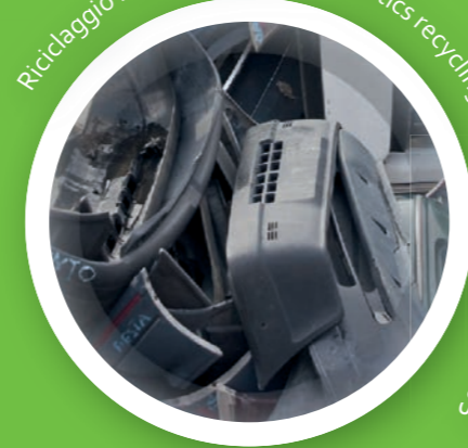
Riciclaggio materie plastiche - Plastics recycling