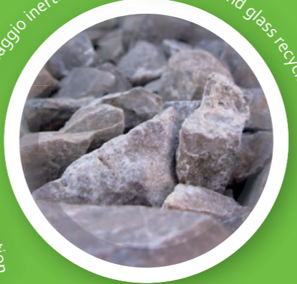
Riciclaggio inerti e vetro - Aggregates and glass recycling