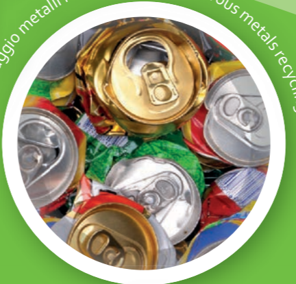
Riciclaggio metalli non ferrosi - Non-ferrous metals recycling