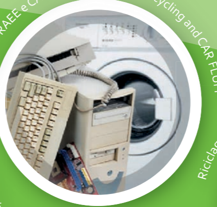
Riciclaggio RAEE e CAR FLUFF - W.E.E Recycling and CAR FLUFF